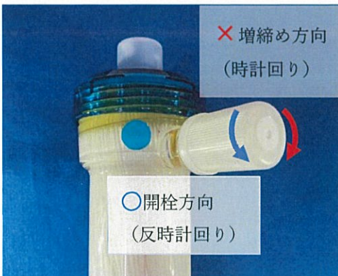
図3 FP-D 開栓時の方向 (反時計回りに回してください)